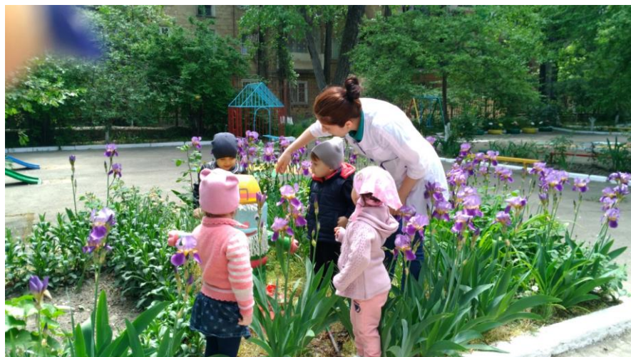
Наблюдение за ветром